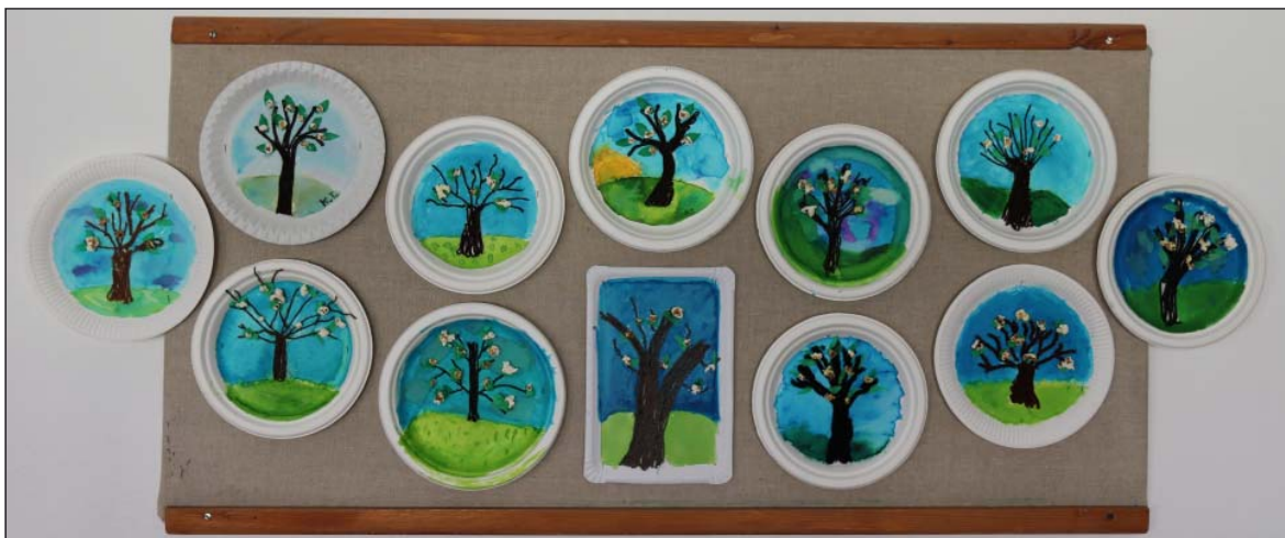
Nástenka s výtvarnými dielami na tému JAR JE TU