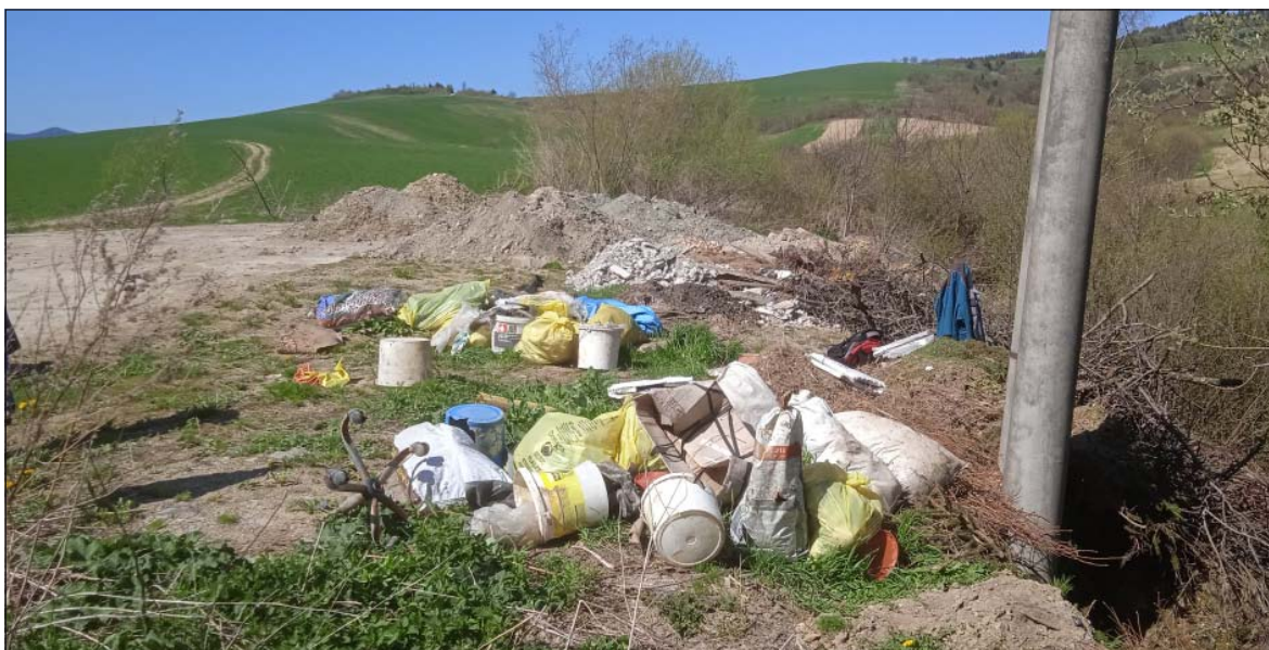
Čierna skládka „Na okrúhlejš“

inzercia • inzercia • inzercia • inzercia • inzercia • inzercia • inzercia • inzercia