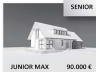
JUNIOR MAX 90.000 €

PROJEKT PRE STAVEBNÉ POVOLENIE OD 1200 EURO MATERIÁL PRE HRUBU STAVBU OD 12.200 EURO STAVBA NA KľÚČ OD 51.500 EURO