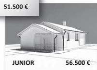
JUNIOR 56.500 €