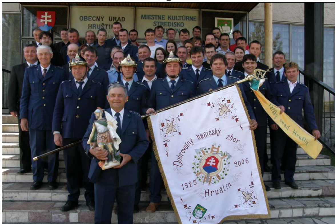
V nedeľu, 3. mája, si na sv.omšiach uctili svojho patróna sv. Floriana hasiči DHZ Hruštín a DHZ Vaňovka. Po nich sa zišli na posední v zasadačke OcÚ.