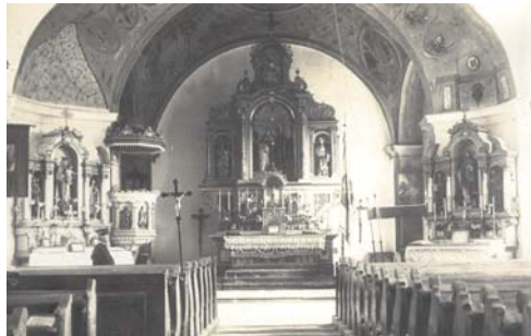
Interiér kostola v r. 1930