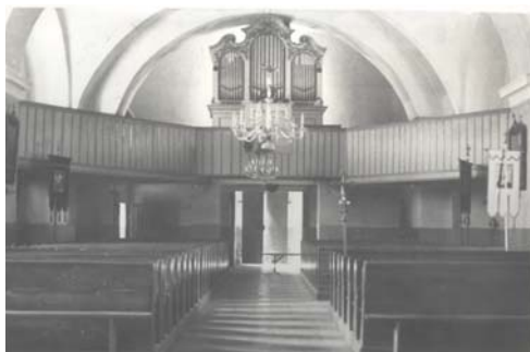
Úprava interiéru kostola r. 1949 (chór, lavice, dlažba, obielenie stien)