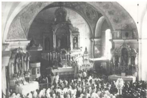
Bohoslužba na odpustovú slávnosť r. 1940