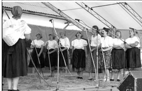
8. júla vystupovala naša folklórna skupina na Folklórnom festivale Dolnej Oravy vo Veličnej.