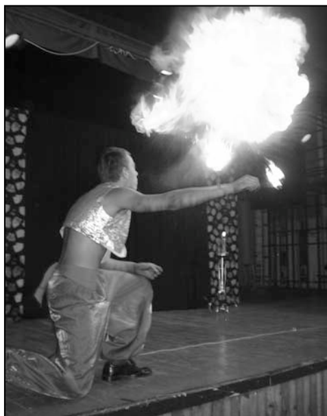
V utorok, 4.júla, sa v Kultúrnom dome v Hruštíne predstavili so svojim programom varetní umelci.

z podujatia • z podujatia • z podujatia • z podujatia • z podujatia