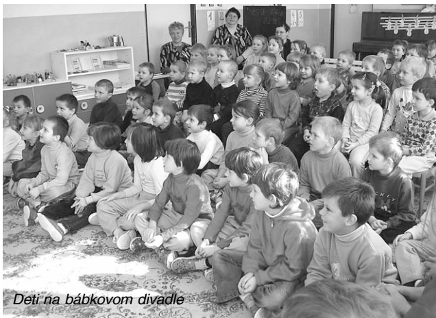
Deti na bábkovom divadle